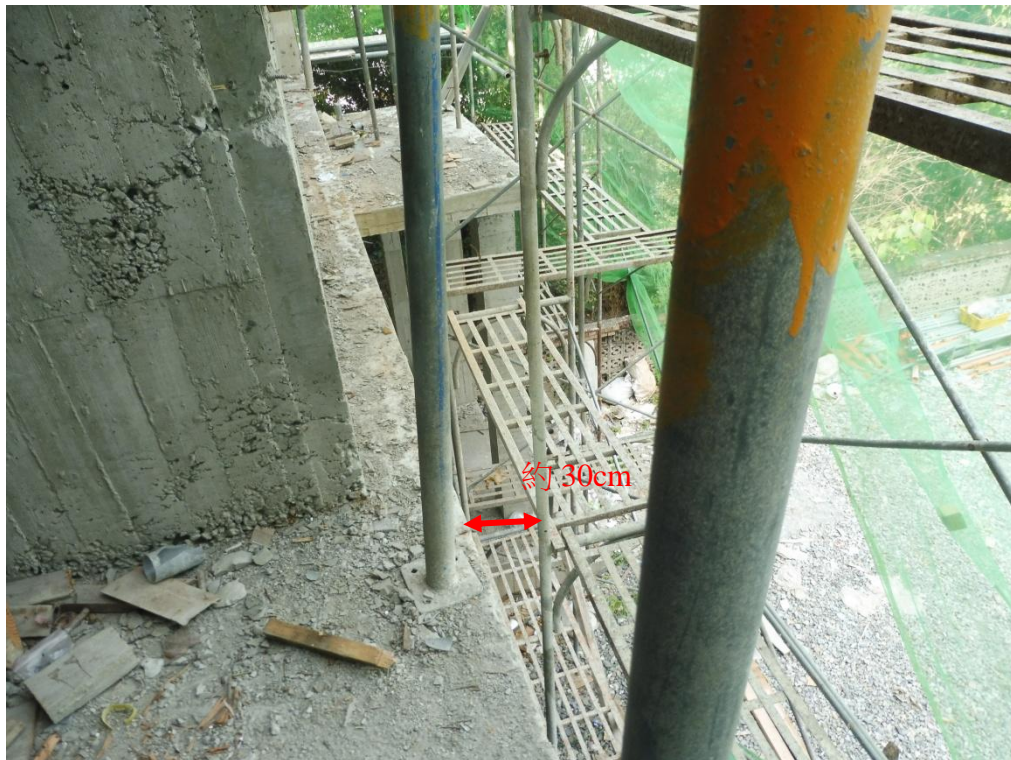
附照 2：2 樓樓板開口部分未設置護欄，與外牆施工架間隙開口約 30 公分。